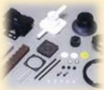
プラスチック射出成形部品

高品質・短納期・低コストを目指しお客様から信頼をいただいています。今後も、ひとつひとつの製品にこだわることで、お客様に満足いただけるよう努めます。