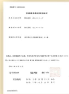
医療機器製造登録証