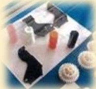
フォーム・インサート成形部品