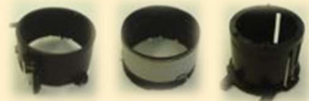
光学ズームレンズ鏡筒部品

汎用プラスチックからスーパーエンブラまで、あらゆる材質での射出成形加工が可能です。