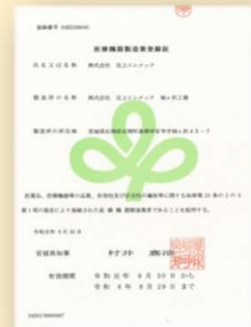
医療機器製造登録証