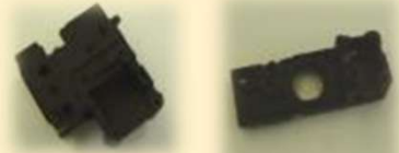
高画素光学レンズ鏡筒部品